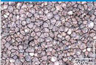
従来3種品の気泡写真