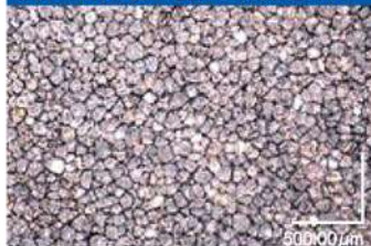
スタイロフォームFGの気泡写真